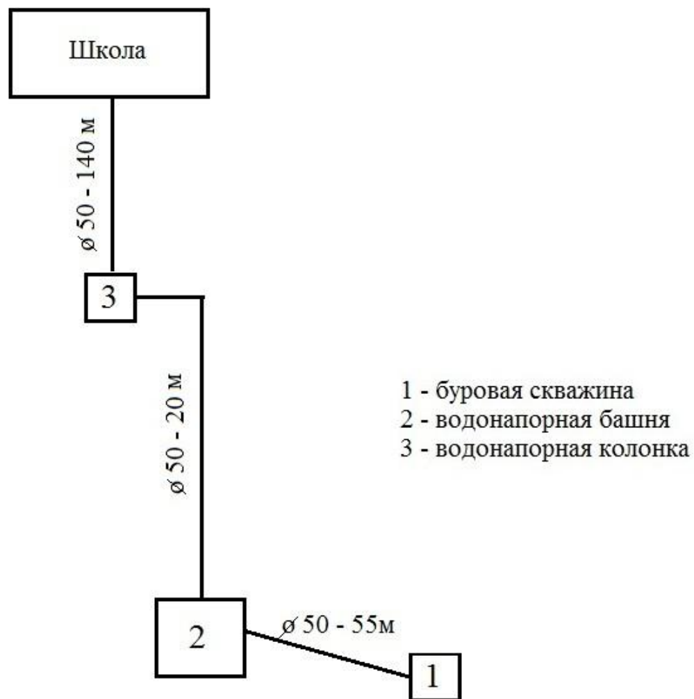
Схема существующего размещения объектов централизованной системы водоснабжения в п. Сосновка МО «Сосновское»