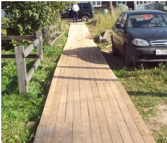
Тротуар (в том числе тротуарной плиткой)